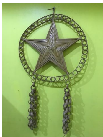
Bamboe parol, Filipijnse symbool voor kerst

Als je/u op deze link klikt (of kopieert), dan kunt u een filmpje bekijken over de langham preek training via zoom.