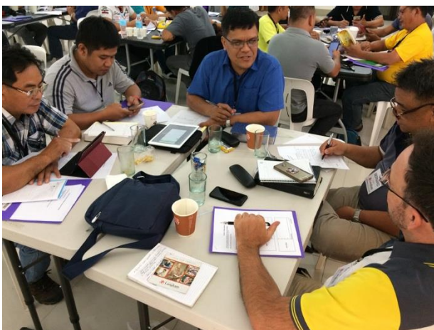
Er werd hard gewerkt.