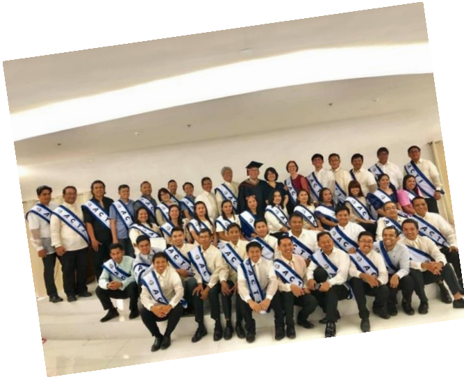
ACTS leerkrachten training

uiteindelijk was het gedaan. Onze oprichter Hudson Taylor zei: elk goed christelijk werk is eerst onmogelijk, dan moeilijk en dan klaar ... Dit gold ook voor mijn scriptie. Mijn titel was: Dialogen van Pijn en Boosheid: Uitingen van Profetische en Goddelijke Emotie in het Boek Jeremia.