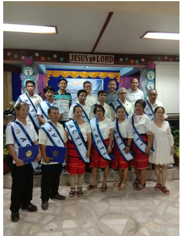
ACTS Ifugao (bergstammen)